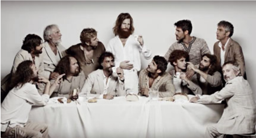
Abb. 12: Werbung im Zeichen der Italianità, Mocarabia, L'arte italiana del buon gusto. 29

Diese nur angedeuteten Beispiele zeigen auf, wie sich religiöse, künstlerische, politische, mediale und wissenschaftliche Blicke überlagern können. Die verschiedenen Blicke sind nicht immer scharf voneinander zu trennen, sie gehen ineinander über.