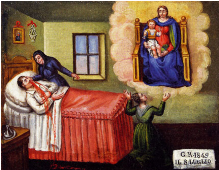
Abb. 6: Votivbild, Öl auf Leinwand, 39,5 x 50,5 cm, 1849, Santuario della Madonna del Boden, Museo del Paesaggio, Verbania.

Der Blick und das Schauen können als Handlung gegenüber einem materiellen Bild wie auch als innere Haltung im Kontext des Gebets oder der Meditation verstanden werden. 18 Schauen ist eine grundlegende Handlung im Rahmen zahlreicher religiöser Praktiken, der reziproke Blick eine Form der Begegnung von Gläubigen und Göttlichem. Anhand eines Votivbildes aus der Mitte des 19. Jahrhunderts, kann ein breites Repertoire von Blicken eruiert werden, das für die Frage der Rezeption- und Produktion von Bildern beispielhaft ist (Abb. 6). 19 Das Bild stammt aus Ornavasso, einer Valsler Siedlung in Norditalien.