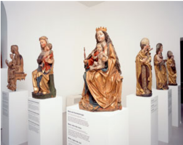
Abb. 3: Saal 4 der Ausstellung Maria Magdalena Mauritius. Umgang mit Heiligen, 09.11.2007–24.03.2008, Schweizerisches Nationalmuseum Zürich

Das gleiche Bildmotiv wandert durch verschiedene Medien, Sprachen, gesellschaftliche Schichten, Zeiten und unterschiedliche religiöse Bezugsrahmen (vom vorreformatorischen Kontext zum barocken Katholizismus). Damit verändern sich die Rezeptionskontexte, in denen die Bilder betrachtet werden. Bilder verändern sich nicht nur im Fluss der Tradierung durch die Zeit, sondern auch im Übergang von unterschiedlichen gesellschaftlichen Bereichen. Dieser Aspekt der Bildforschung ist besonders signifikant, wenn man die heutige Verwendung von religiösen Bildern fokussiert. Das Vorkommen religiöser Motive ausserhalb der Einflussbereiche religiöser Institutionen erweist sich als zunehmend wichtig und – angesichts von Säkularisierungstheorien – auffällig. 13 Mit einem Vergleich unterschiedlicher Repräsentationen Marias möchte ich auf diese Dynamik visueller, religiöser Kommunikation hinweisen (Abb. 3–5).