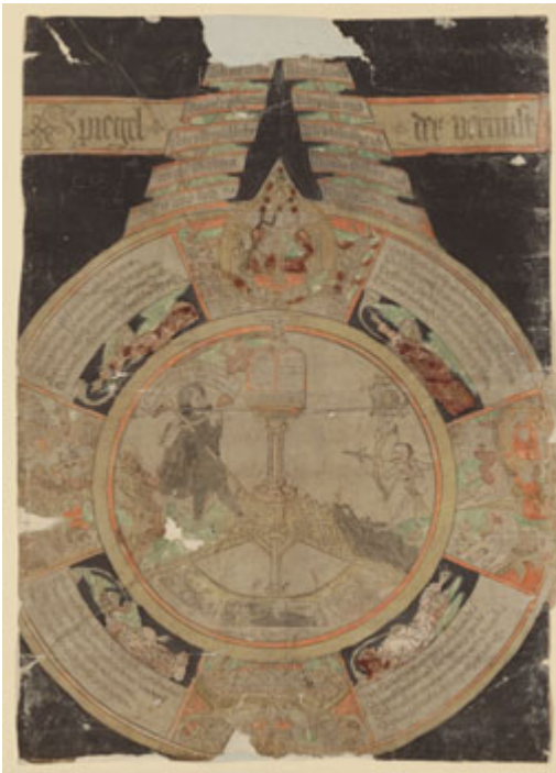
Abb. 2: Spiegel der Vernunft , kolorierte Xylographie, ca. 1488, 40,4 x 29,1 cm, mit freundlicher Genehmigung der Staatlichen Graphischen Sammlung, München, Inv. N. 118319 D.

engen Wechselwirkung von Bild und Text. Zuerst einmal im Bild selbst: Die lateinischen Schriften in den Bannern unterstützen die performative Absicht des Bildes, das zur persönlichen Andacht dient. Das Gemälde verweist aber auch auf verschiedene Aspekte der katholischen Lehre und Gebetspraxis. Auch die Verbindung zur literarischen Gattung des Speculum ist explizit hervorgehoben. 12 Sodann nimmt das Bild auch auf andere Bilder Bezug: Es steht nämlich nicht nur in Wechselwirkung zu theologischen Lehren und zu bestimmten Praktiken, sondern auch in einer eigenen Bildtradition. Eine kolorierte, vorreformatorische Xylographie von 1488 präsentiert das gleiche Motiv, was nahe legt, das barocke Bild als Aktualisierung einer mittelalterlichen Vorlage zu betrachten (Abb. 2).