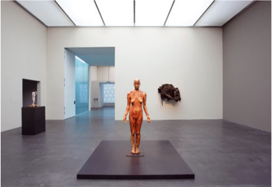
Abb. 4: Virgin Mary , Kiki Smith, 1992, Wachs, Käsetuch, Holz, Stahlhalterung, H 171 x B 66 x T 36 cm, Ausstellung Lebenszeichen , Kunstmuseum Luzern 2010, Photo: Andri Stadler, KML, mit freundlicher Genehmigung von Kiki Smith (courtesy Pace Gallery).

Ganz in diesem Kontext von Museum und Kunst ist Kiki Smiths Virgin Mary entstanden, hier präsentiert in einer Ausstellung im Kunstmuseum Luzern (Abb. 4).