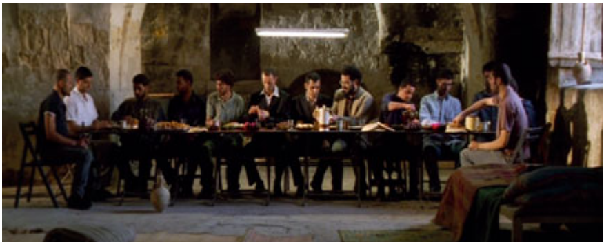
Abb. 10 und 11: Zwei filmische Inszenierungen des letzten Abendmahls in Pier Paolo Pasolinis IL VANGELO SECONDO MATTEO (01:41:57) und Hany Abu-Assads PARADISE NOW (00:32:45).

Auch in der Werbung ist dieses Motiv geliebt. Der italienische Brand Mokarabia hat 2013 ein neues Produkt auf den Markt gebracht, dessen Werbekampagne die Darstellung der Ultima Cena explizit aufgreift und stilistisch auf Pasolinis Werke hinweist (Abb. 12). Mit dieser Adaption der Ultima Cena wird ein wirtschaftsstrategischer, gewinnorientierter Blick auf das religiöse und das künstlerische Motiv geworfen: Im Werbevideo werden Kunst und Kaffee als exzellente Merkmale italienischer Kultur parallelisiert.