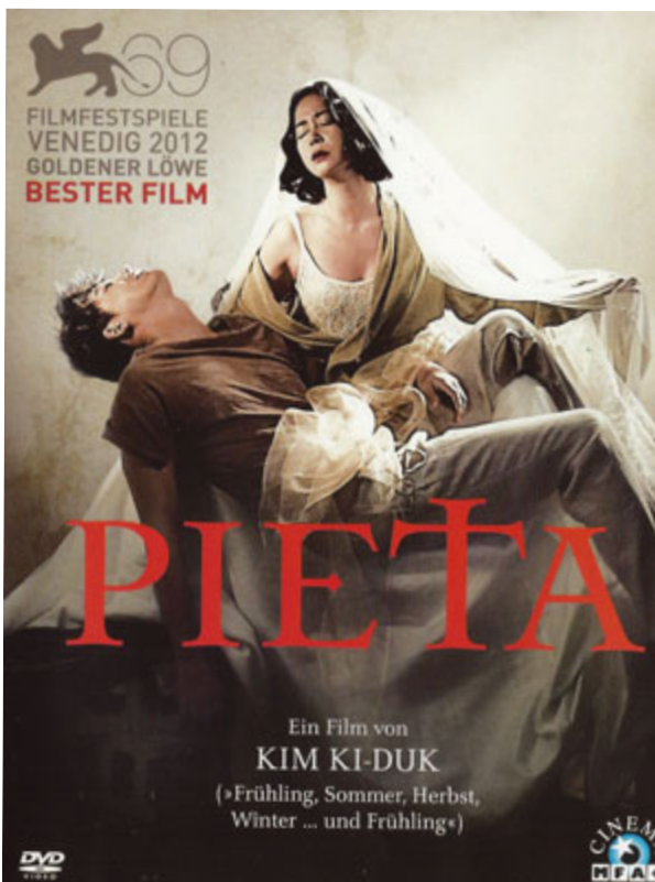
Abb. 7: Pietà (Kim Ki-duk, KR 2012), DVD-Cover nach der MFA-Ausgabe.

Betrachtet man heute solche Votivbilder im Kontext von ethnographischen Museen, verändert sich der Blick auf diese Werke grundlegend: Ja nach dem, ob man mit dieser religiösen Praxis vertraut ist oder ob man als Tourist oder Forscherin das Bild betrachtet, sind die Bedeutungen, die sich in diesen verschiedenen Blicken herauskristallisieren, verschieden. Die religiöse Valenz des Bildes wird in einem breiten Bogen rezipiert, der sich möglicherweise von persönlicher Frömmigkeit bis hin zum wissenschaftlichen Interesse erstrecken kann. Es wurde bereits aufgezeigt, wie Bilder durch unterschiedliche Zeiten und gesellschaftliche Bereiche wandern. In Bezug auf die Frage der Rezeption und der Produktion von Bildern ist besonders auch ihre Diffusion durch unterschiedliche Kulturen und religiöse Kontexte relevant. Ein aktuelles Beispiel liefert hier die Verwendung des Motives der Pietà in unterschiedlichen Werken, die in den letzten Jahren entstanden sind (Abb. 7 und 8).