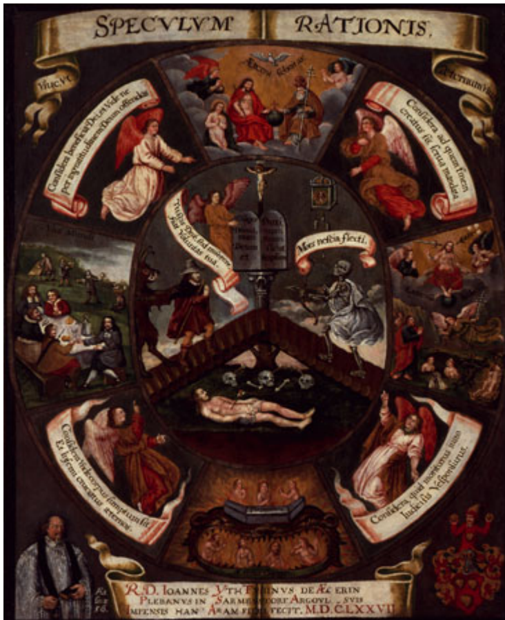
Abb. 1: Speculum rationis , Öl auf Holz, 112 x 86 cm, 1677, Beinhaus St. Michael, Oberägeri, mit freundlicher Genehmigung des Amtes für Denkmalpflege und Archäologie Zug, Foto Alois Ottiger.

Anhand ausgewählter Quellen möchte ich einen möglichen Weg aufzeigen, um Bilder als Medien mit ihrer spezifischen Leistung für religiöse Symbolsysteme zu untersuchen. In diesem Abschnitt stehen deshalb die Bilder als kulturelle Erzeugnisse und wesentliche Medien der Produktion religiöser Bedeutungen im Zentrum. Es geht um die Frage der visuellen Repräsentation.